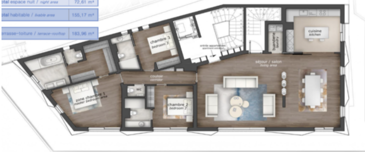
Toit-terrasse privatif appartement R+2 = 183,96 m 2 private rooftop apartment R+2