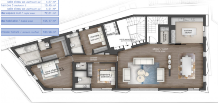
Toit-terrasse privatif appartement R+2 = 183,96 m 2 private rooftop apartment R+2