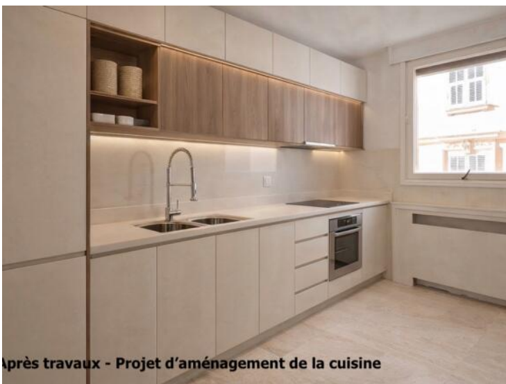
Après travaux - Projet d'aménagement de la cuisine