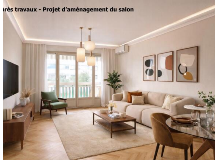
Après travaux - Projet d'aménagement du salon