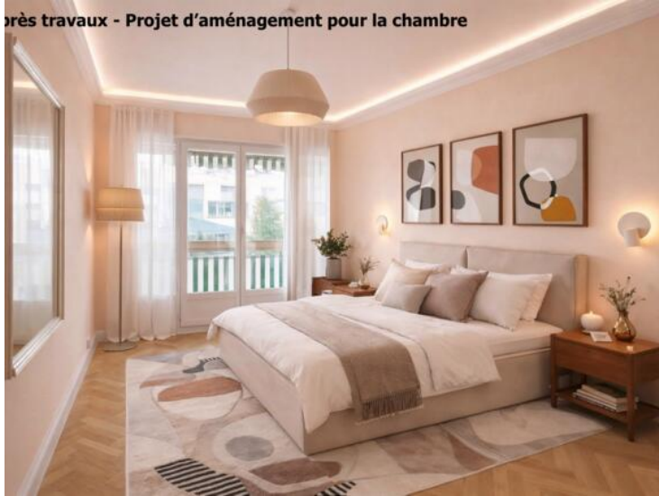
Après travaux - Projet d'aménagement pour la chambre