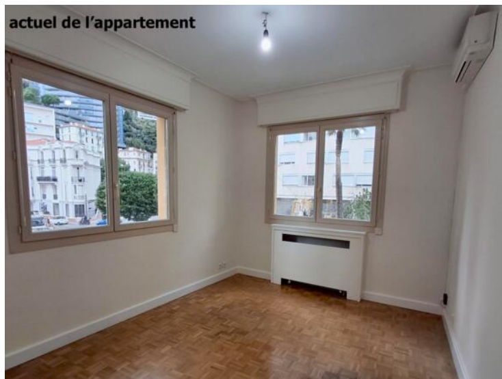
actuel de l'appartement