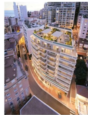
Plans, images, textes et surfaces non contractuels.