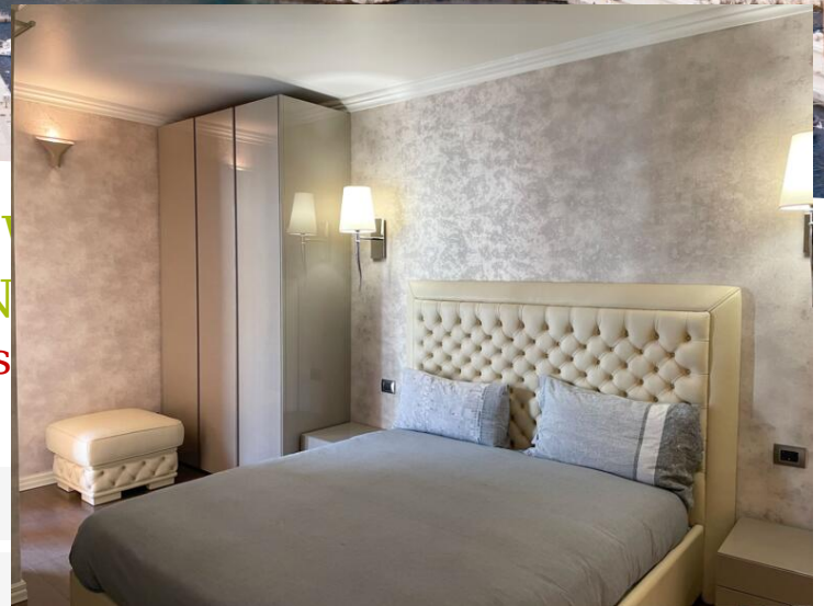
Die Wohnung bietet einen schönen Blick