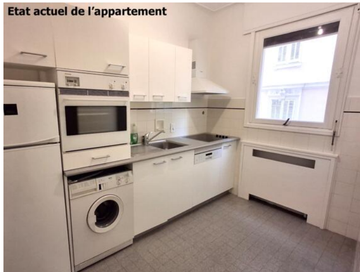
Etat actuel de l'appartement