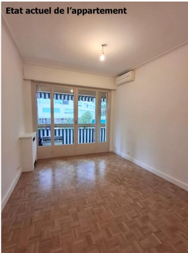
Etat actuel de l'appartement