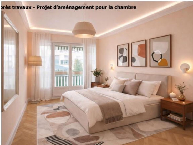
Après travaux - Projet d'aménagement pour la chambre