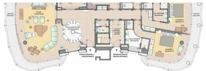
Master bedroom floor :