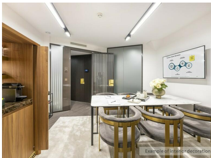
Example of interior decoration