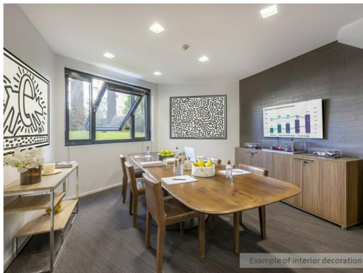
Example of interior decoration