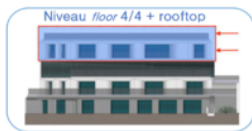
Toit-terrace privatif appartement R+2 = 183,96 m² private rooftop apartment R+2