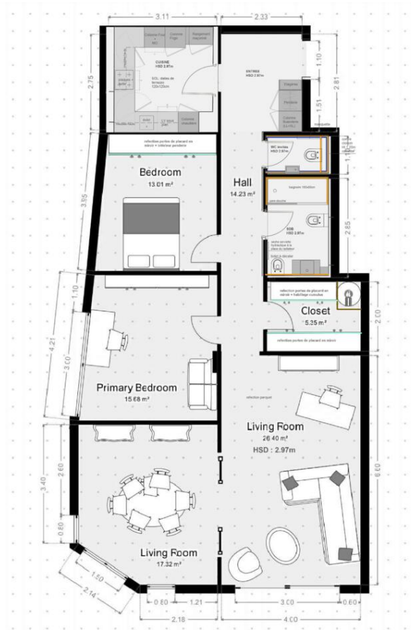
LE SANTA MONICA - Plan

Emma Ruspantini Tél : +377 6 40 61 13 70/+377 93 50 54 64 emma@continentale.mc www.continentale.mc