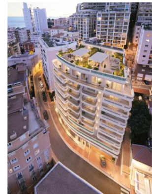
Plans, images, textes et surfaces non contractuels.

MAÎTRE D'OUVRAGE SCI NETTANI Représentée par Monsieur Eric SEGOND GRUPE SEGOND PROMOTION 45 Rue Grimaldi - 98 000 Monaco - Tél: +377 92 05 35 77