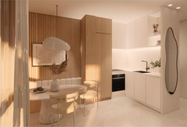
CUISINE + S MANGER