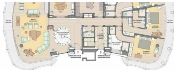
Master bedroom floor :