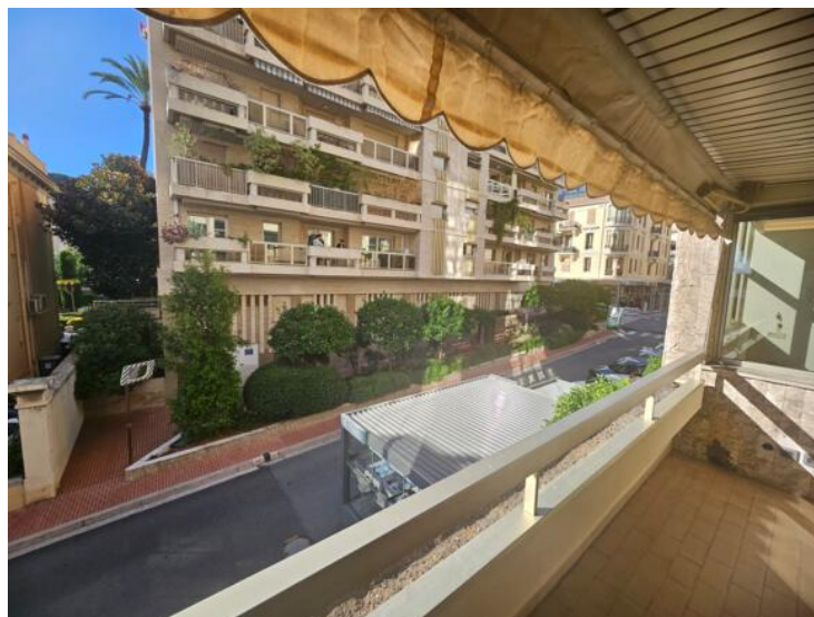
Palier niveau 1