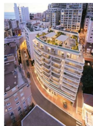
Plans, images, textes et surfaces non contractuels.