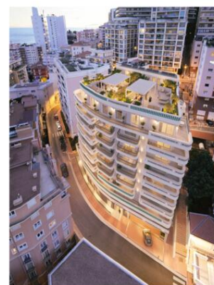
Plans, images, textes et surfaces non contractuels.

MAÎTRE D'OUVRAGE SCI NETTANI Représentée par Monsieur Eric SEGOND GRUPE SEGOND PROMOTION 45 Rue Grimaldi - 98 000 Monaco - Tél: +377 92 05 35 77