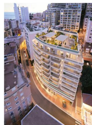
Plans, images, textes et surfaces non contractuels.