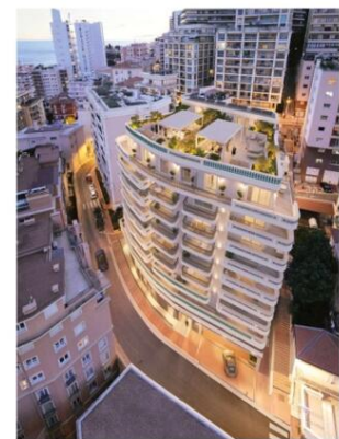
Plans, images, textes et surfaces non contractuels.