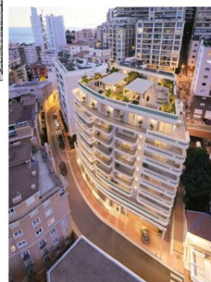
Plans, images, textes et surfaces non contractuels.