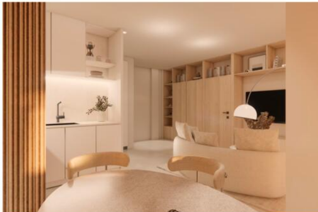
CUISINE + SA MANGER