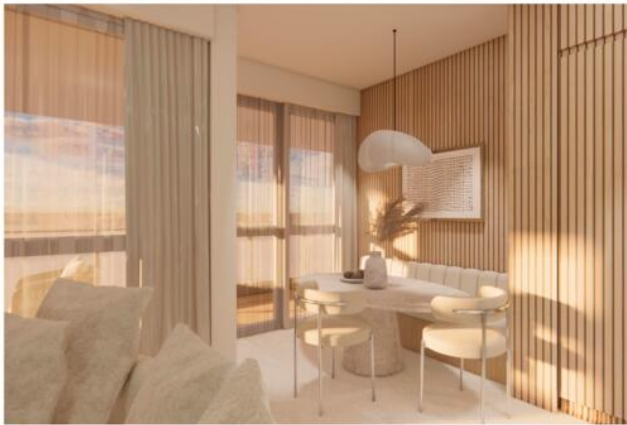
CUISINE + SA MANGER