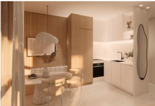
CUISINE + S MANGER