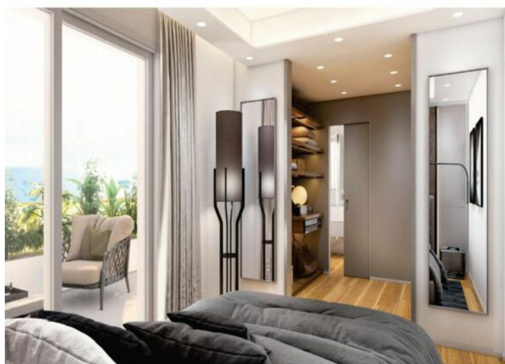
m 01 looking dressing area