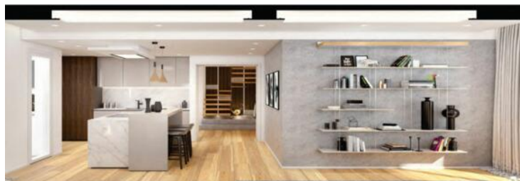
Living area looking the kitchen