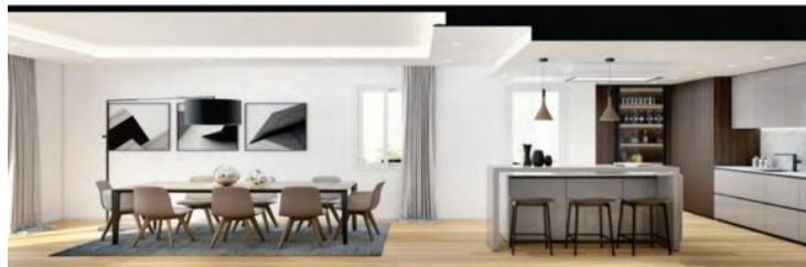
Living area looking the dining and kitchen zone