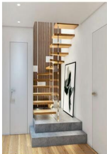
Living area with the staircase