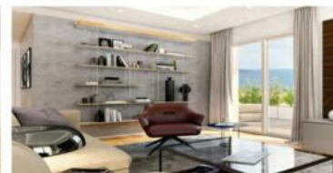
View of the living area