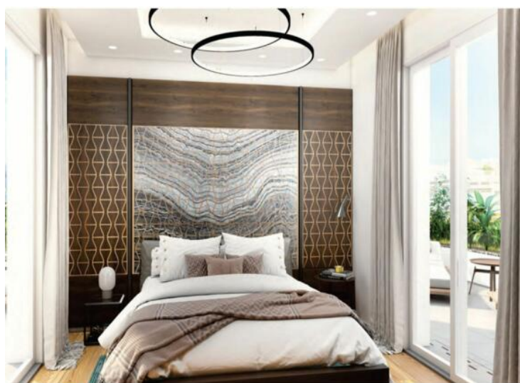
idroom: the taller made head board with Synergy Shape product