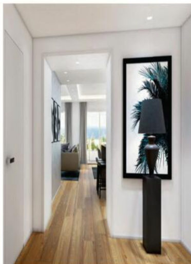
The entrance area