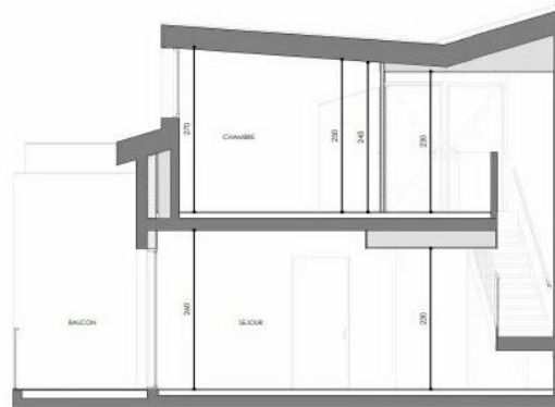
COUPE DE PRINCIPE

HALL A APPARTEMENT DE 5 PIÈCES DUPLEX n° A301 au 3ème étage