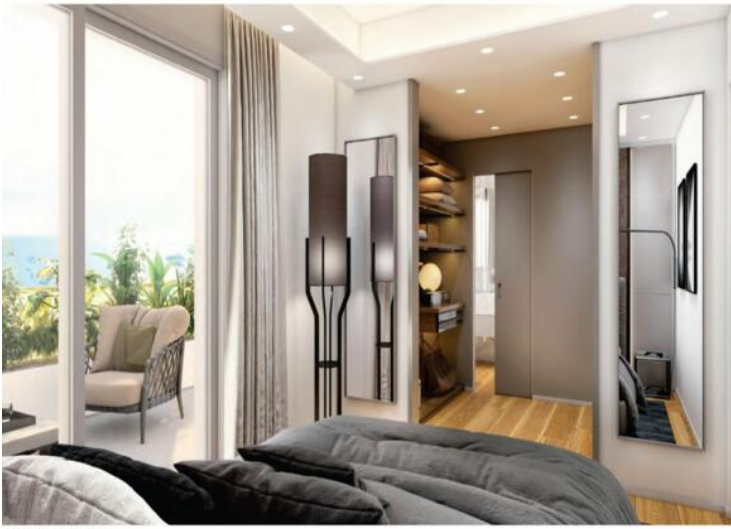
m 01 looking dressing area