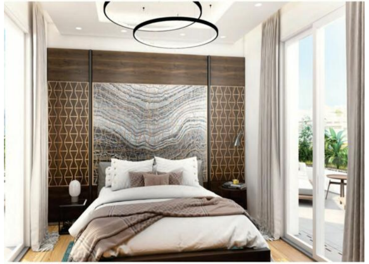
bedroom: the tailor made head board with Synergy Shape product