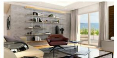
View of the living area