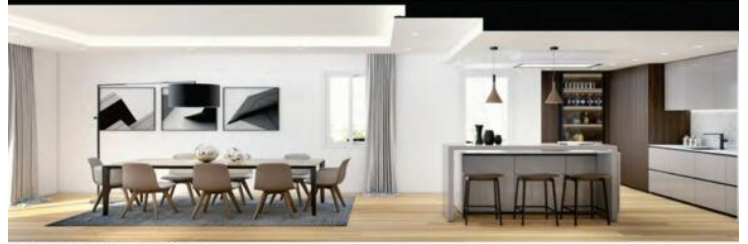
Living area looking the dining and kitchen zone