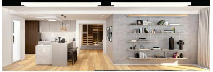
Living area looking the kitchen